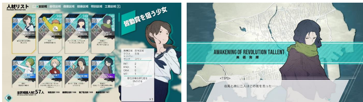
※Nintendo Switch 版の画像です。